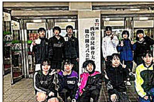
西宮市民大会での中学生の活躍

また、中高年シニアの方も若い人たちと競技を通して「技術」を身につけ、楽しめるようにできたらという考えもあり、現在は年間で6～7回程度、中央体育館8面をすべて開放して、バドミントンの普及に務めております。